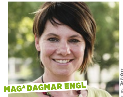
MAG A DAGMAR ENGL